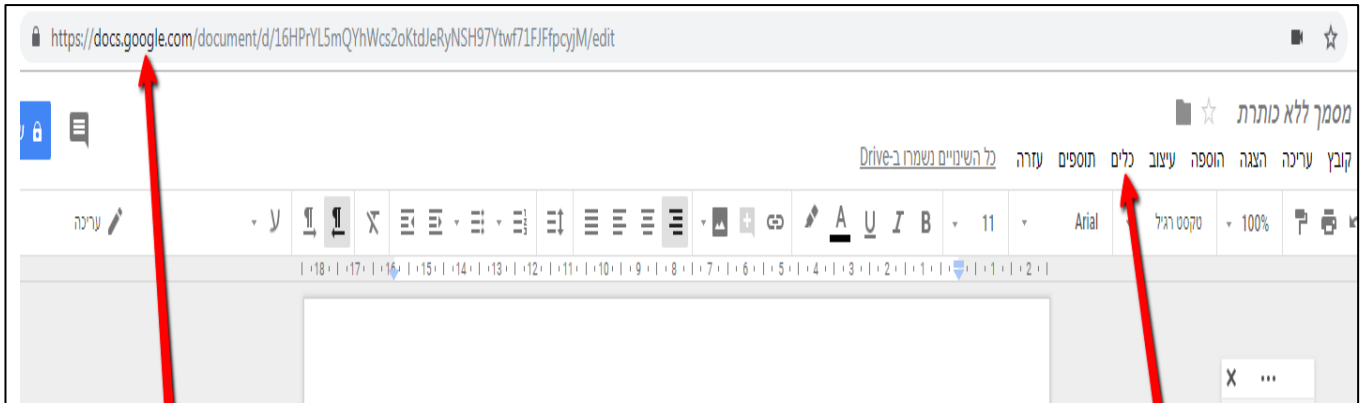
Figure 1 הסבר על לשונית כלים