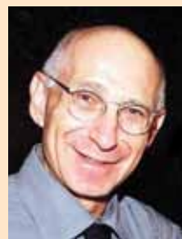
פרופ' שלמה וינר