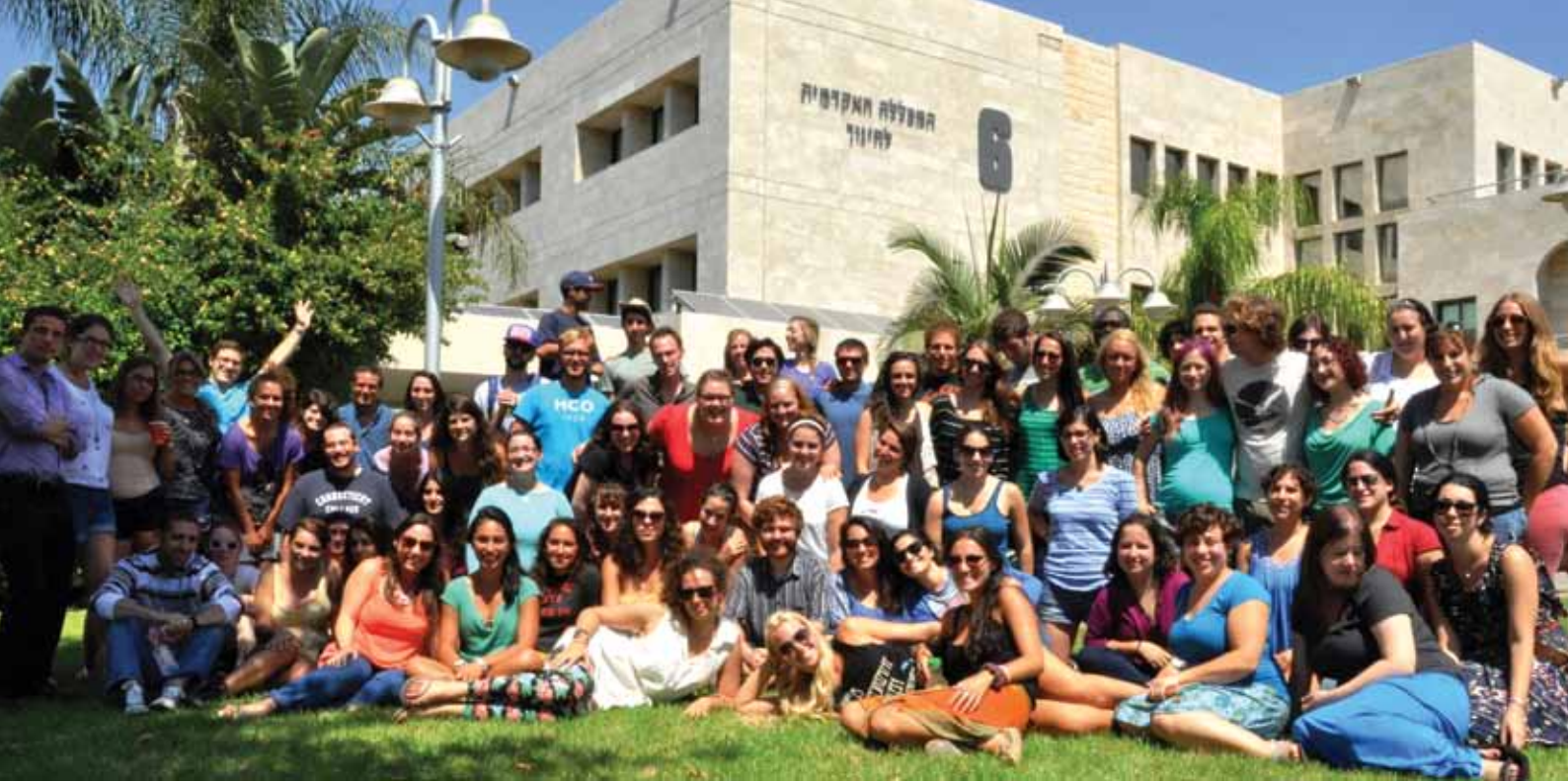
משתתפי תוכנית "מסע" 2012