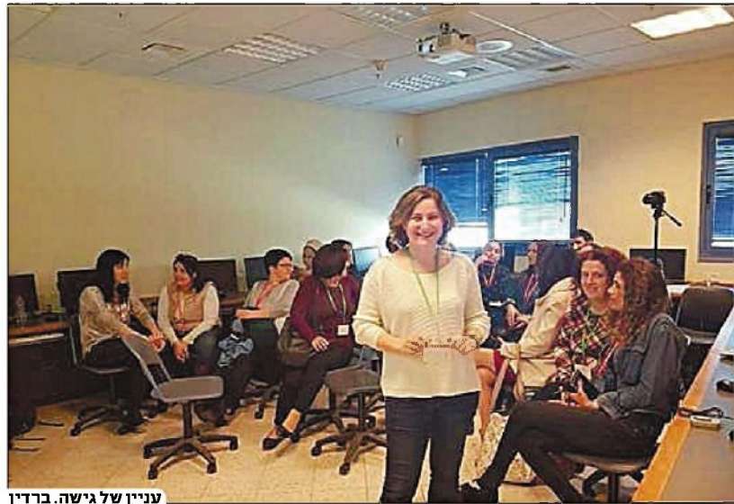
עניין של גישה. ברדין

” הרתיעה ממתמטיקה היא לא ממתמטיקה אלא ממורי המתמטיקה, הבעיה היא בגישה” איטה ברדין