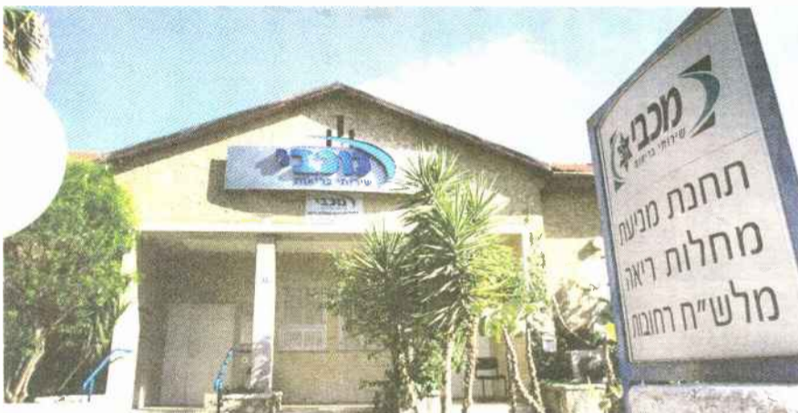
מלש"ח רחובות. לכאן היו המסמכים אמורים להגיע

שנחשף לגביה. "עצם הידיעה שהפרטים שלי חשופים כך במסמך רפואי, זהו דבר שבעיניי מוזעזע וחמור מאוד. אני חושבת שהיו צריכים לעשות יותר כדי שדבר כזה לא יקרה. לא יכול להיות שהפרטים האישיים שלי מסתובבים ככה, בעיקר לא בהקשר למחלה זו או אחרת. אני חיי ששת בעיקר כי אני לא יודעת מה ניתן לעשות עם הפרטים הללו. משהו צריך לתת את הדין על העניין הזה".