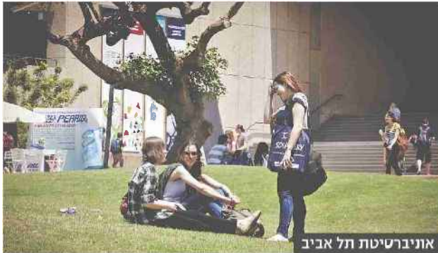
אוניברסיטת תל אביב

"האוניברסיטאות לא מתחרות על אותה אוכלוסייה שעליה מתחרות המכללות", אומר בכיר באחת האוניברסיטאות. "מי שיש לו תנאי קבלה טובים יעדיף ללל ספק ללמוד באוניברסיטאות, והיתרון ילכו למקומות אחרים". בכיר במכללה מובילה טוען כי "המכללות עשו הרבה כדי להנגיש את ההשכ-